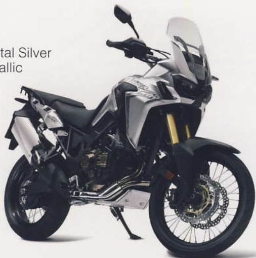
Digital Silver Metallic