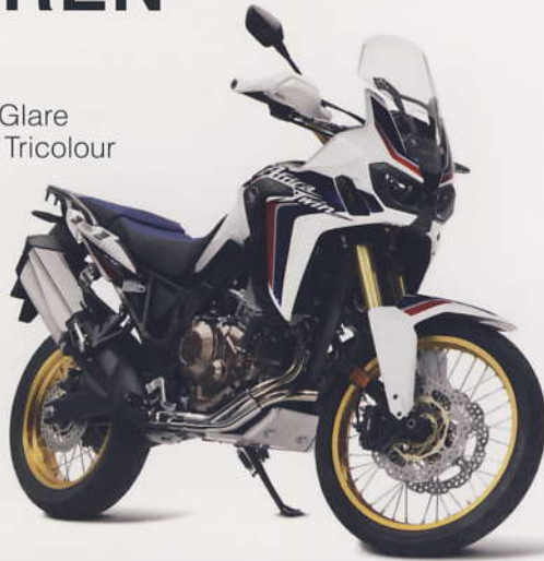
Pearl Glare White Tricolour